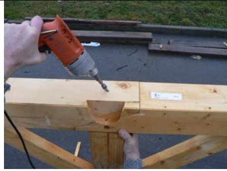
*3* ASSEMBLAGE DES DEUX SABLIERES (1) ET (4) PAR VIS VBA 6 x 200