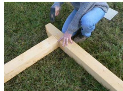
CHEVILLAGE DES ASSEMBLAGES NE PAS ENFONCER LA CHEVILLE COMPLETEMENT. ASSEMBLAGE POTEAU ET SABLIERE