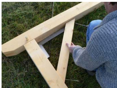
LAISSEZ UN JEUX DE 35 MM ENTRE LE DESSUS DE LA PIECE (1) ET LE DESSUS DE LA PIECE (6). METTRE L'ENSEMBLE D'EQUERRE AVANT DE VISSER CELUI-CI.