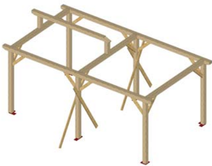
ASSEMBLAGE FAITIERE (2) ET POINCON (7) SUR RETOUR (5) PAR CHEVILLES BOIS