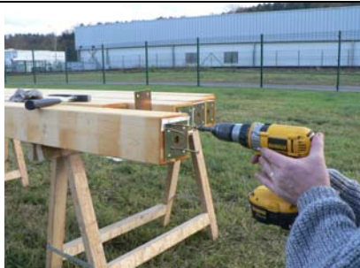
VISSAGE DE LA CONTRE PLAQUE SOUS POTEAU PAR 4 VBA 5 X 60