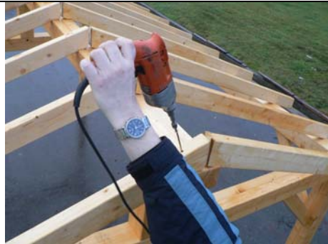
VISSAGE DES CHEVRONS (9) PAR VIS VBA 6 X 160 EN COMMENANT PAR LA FAITIERE