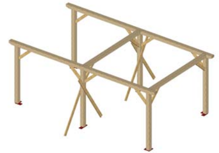
ASSEMBLAGE DU PORTIQUE ARRIVEE IDEM à *2* ASSEMBLER LES SABLIERES DETAIL *3* ET MISE EN PLACE DU RETOUR (5) DETAIL *4* A REPETER DEUX FOIS.