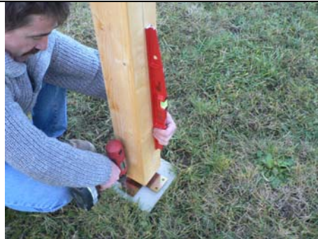
MISE EN APLOMB DE L'OUVRAGE ET FIXATION DES PLATINES SUR LES PLOTS A L AIDE DU NECESSAIRE DE FIXATION FOURNIS.