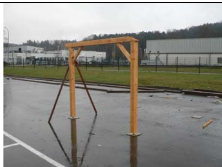
LE MAINTIEN DU PORTIQUE SE FAIT PAR DEUX PLANCHES (NON INCLUSES) MAINTENU PAR SERRE JOINT