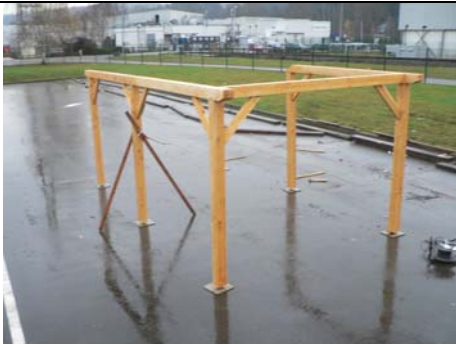
*4* ASSEMBLAGE RETOUR (5) ET SABLIERE (1) (4) + 2 LIENS (10) VISSAGE SELON DETAIL CI-JOINT