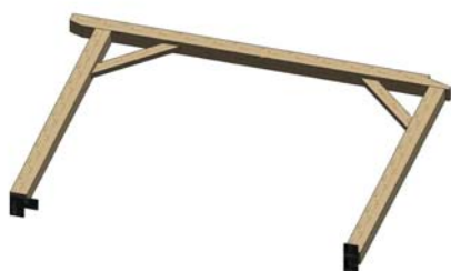
*1* ASSEMBLAGE DU PORTIQUE DEPART POTEAU (6) SABLIERE (1) ET 2 LIENS (10) SUIVRE LES CONSEILS CI-DESSUS PUIS RELEVER L'ENSEMBLE PHOTO CI CONTRE