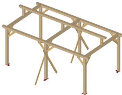
ASSEMBLAGE FAITIERE (3) ET POINCON (7) SOLIDARISER ENSUITE LES FAITIERES PAR VIS VBA 6 X 200