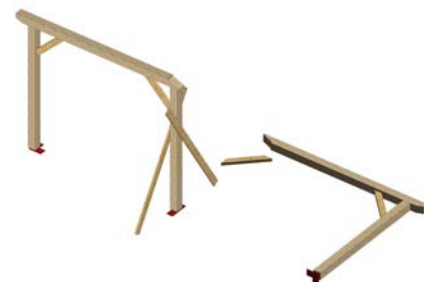
*2* ASSEMBLAGE DU PORTIQUE ARRIVEE POTEAU (6) SABLIERE (4) ET 2 LIENS (10)