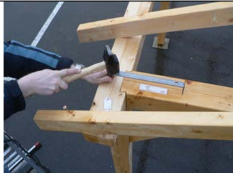
MISE EN PLACE DES GRIFFES ENTRE LES RETOURS (5) ET LES SABLIERES (1) ET (4)