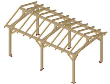
POSE DES CHEVRONS (9) SELON DETAIL CI-DESSOUS