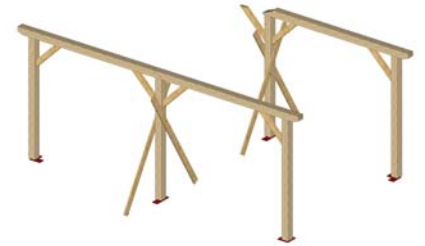
ASSEMBLAGE DU PORTIQUE DEPART IDEM *1* PUIS RELEVER. LES PIECES EN BIAIS SONT FICTIVES ET NE SERVENT QU'AU MONTAGE DE LA STRUCTURE. ELLES SONT MAINTENUES PAR UN SERRE JOINT.