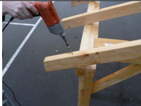
VISSAGE DES CHEVRONS (9) PAR VIS VBA 6 X 160 SUR SABLIERE POUR TERMINER

DISTANCE ENTRE DEUX CHEVRONS (9) DE FACE A FACE 488 MM