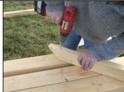
PRE PERCAGE DES PIECES N° (10) POUR FACILITER LA MISE EN PLACE DE CEUX-CI

LAISSEZ UN JEUX DE 20 MM ENTRE LE PLOT ET LE BAS DU POTEAU