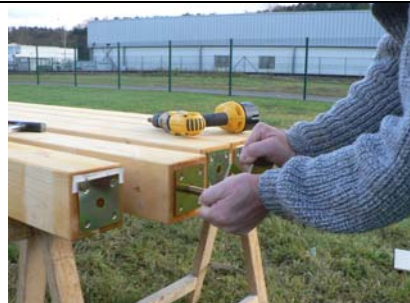
MISE EN PLACE DE LA PLATINE SOUS POTEAU PAR VISSAGE. 2 DROITES POUR LES POTEAUX MILIEU 4 ANGLES POUR LES AUTRES POTEAUX.

LAISSEZ UN JEUX DE 20 MM ENTRE LE PLOT ET LE BAS DU POTEAU